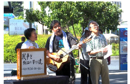
「ドレミの歌」を披露