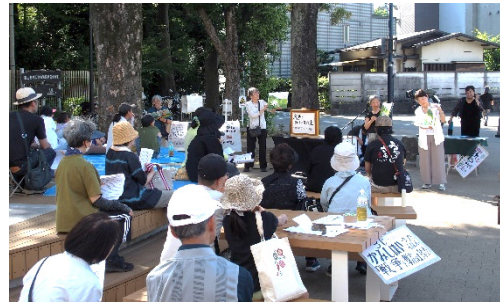
絵本「へいわって すてきだね」